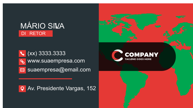
Página 01 (Impressão Frente)