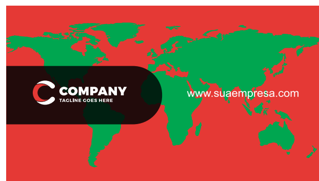
Página 02 (Impressão Verso)

*Atenção: A grade 4x1 o verso tem que ser enviado somente com porcentagem de preto(k)